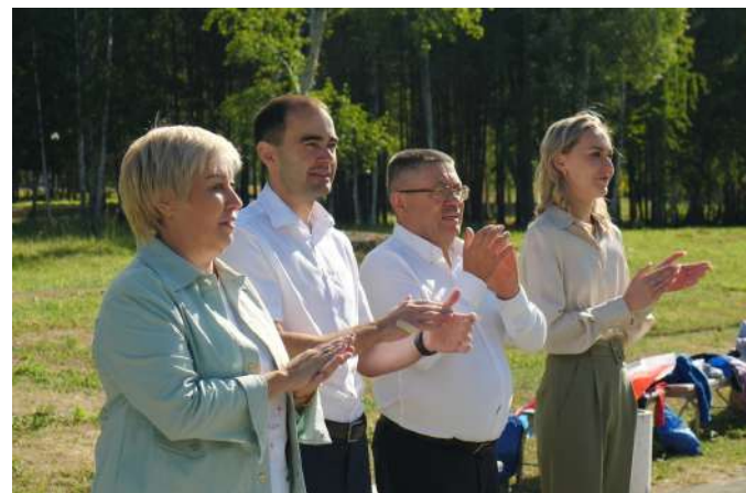
Официальное открытие турнира