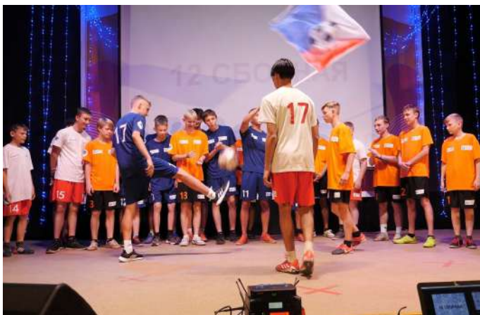
Вечерние концерты в лагере "Самоцветы"