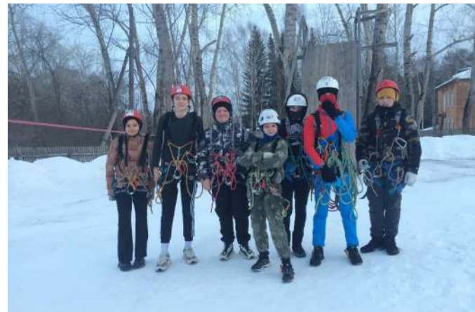
МБУ ДО ДЮСШ г. Верхотурье