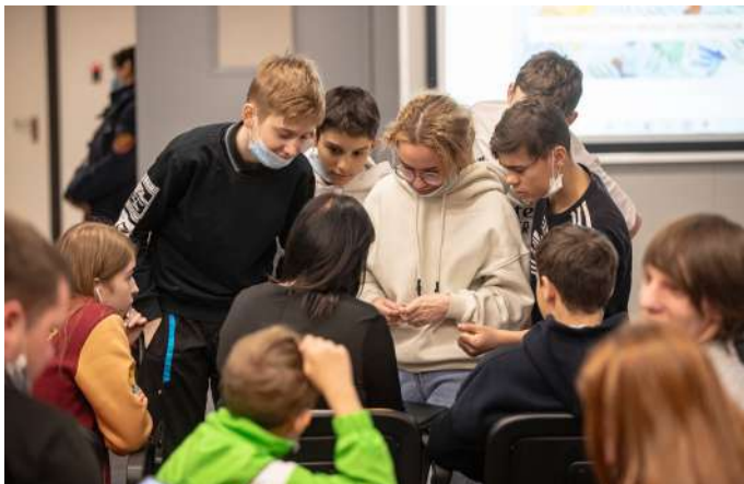
Мастер-класс от пресс-атташе ФК "Урал" на "Екатеринбург-Арене"