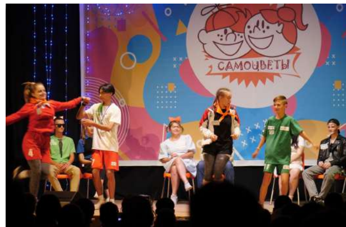
Вечерние концерты в лагере "Самоцветы"