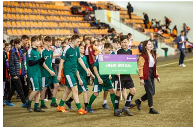
Парад команд-участниц турнира "Будущее зависит от тебя"