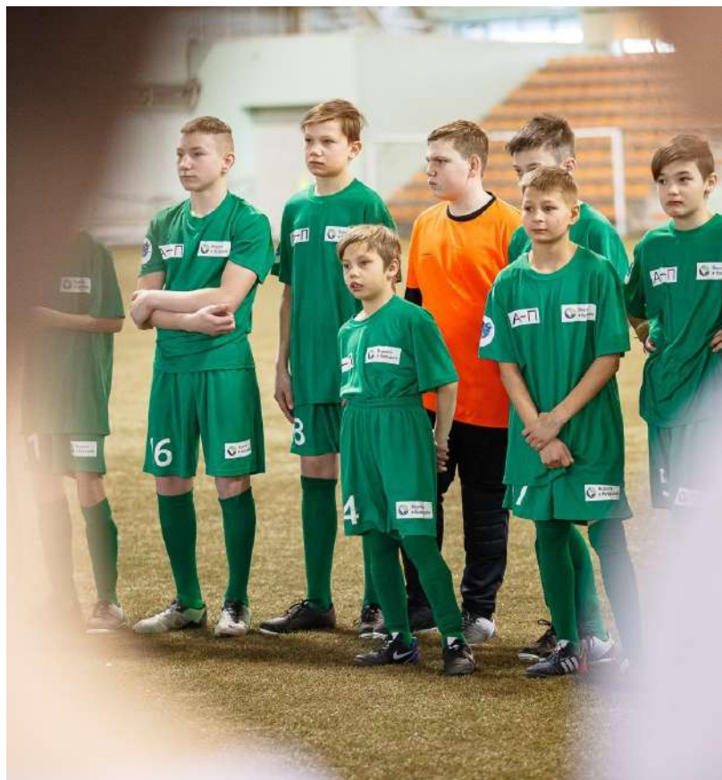
Открытие Соревнований «Будущее зависит от тебя»