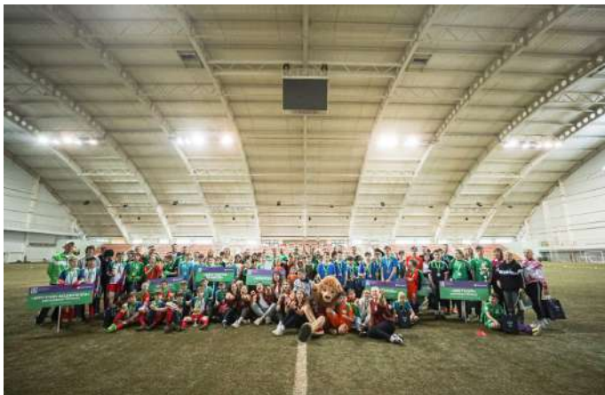
Общее фото всех участников турнира "Будущее зависит от тебя" 2022