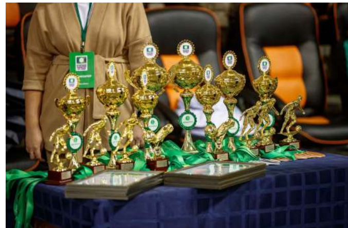
Кубки и медали турнира "Будущее зависит от тебя"