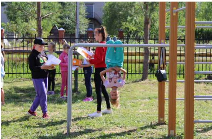
Открытие площадки в пос. Пелым