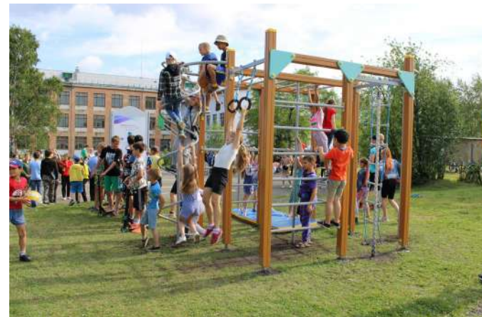
Открытие площадки в пос. Рудничный Фотография из личного архива Фонда Шипулина