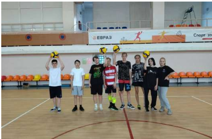
АУ КГО ФОН г. Качканар