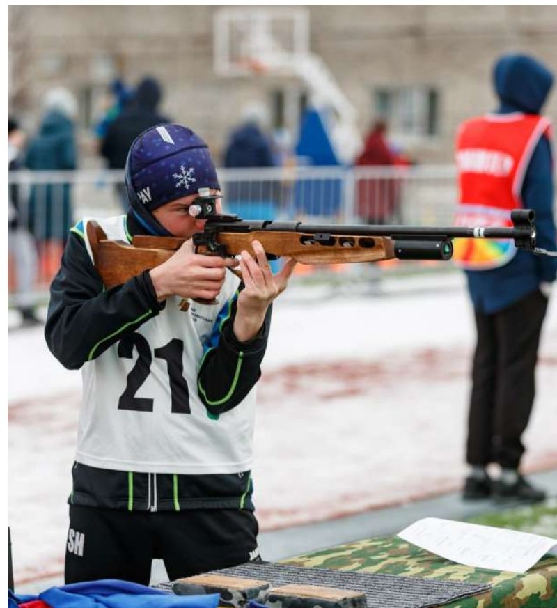
Соревнования «Чемпионы будущего»