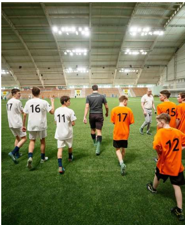
Команда Серёжи "Соболь", г. Невьянск