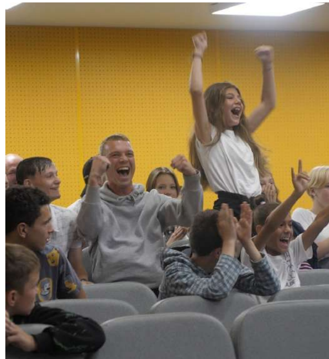
Квиз по футболу на смене