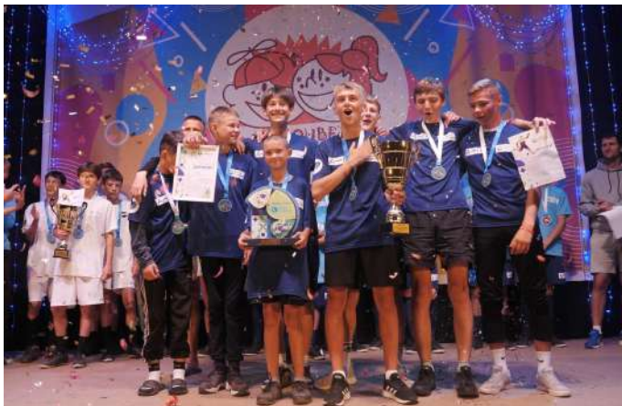
Победители смены, команда "Салда"